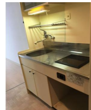
※画像は同タイプ別部屋のものです。